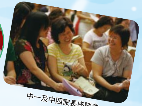
中一及中四家長座談會