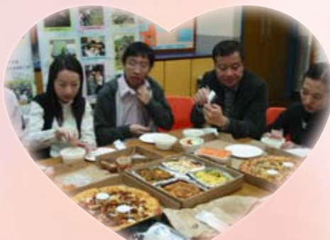
時間有限，班主任要邊吃邊說。