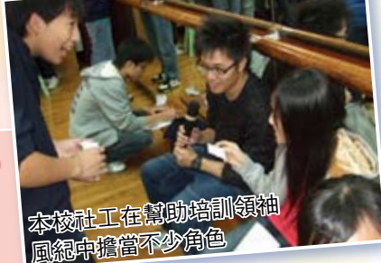
本校社工在幫助培訓領袖風紀中擔當不少角色

淳樸的校風及良好的學習環境能有助同學學習，這一切建立在主耶穌基督的愛和恩典裏面以及關愛的校園文化中。因此，訓導組將會以此為基礎，推行各項工作及措施，維持和諧的校風和良好的學習環境，讓學生快樂地成長。