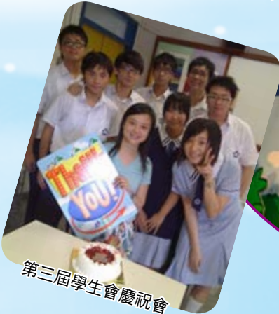
第三屆學生會慶祝會