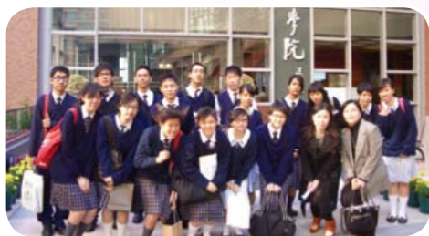
中七同學參觀香港理工大學香港專上學院