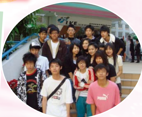
中五同學參觀屯門IVE