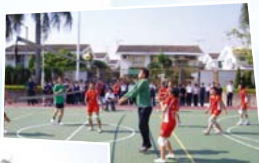
福音排球師生挑戰賽(準決賽)

加之，校牧亦於聖誕假期安排為期五天之室內排球場集訓暨功課輔導，期望隊員在假期中能珍惜溫習及練習的時間，除重視排球訓練外，其培養學生重視學業的態度，建立過有紀律及主動學習的生活，專注預備期中試及即將舉行之元朗區學界排球比賽。