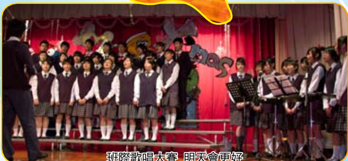
班際歌唱大賽_明天會更好