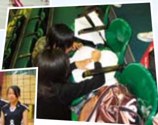
假期集訓：隊員於集訓前提前兩小時到體育館看台上專心溫習