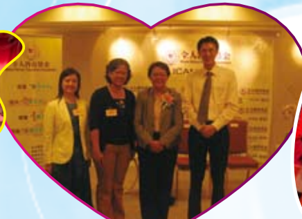
本校老師與范徐麗泰女士合照