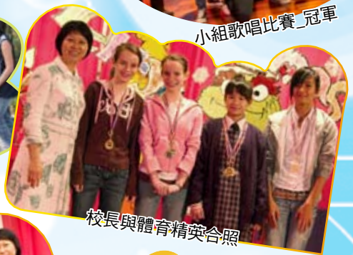
校長與體育精英合照