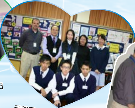
元朗區小學生升中觀校日 英語活動工作坊