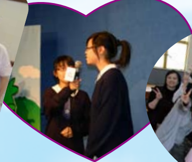
校園電視台 校園小記者