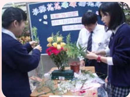
學生分組參加插花比賽