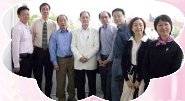
來自湖南長沙的嘉賓參觀校園與林校監、謝校長及何校牧合照