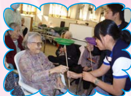
中四同學參加長者義工服務