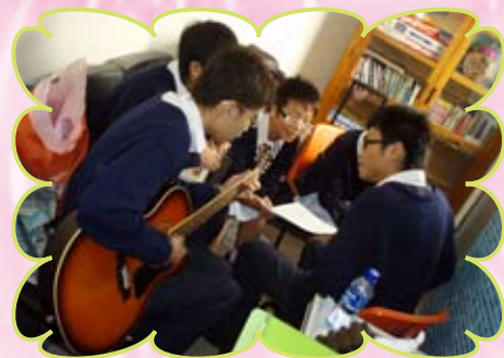
中四同學在社工室練歌