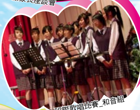
班際歌唱比賽_和音組