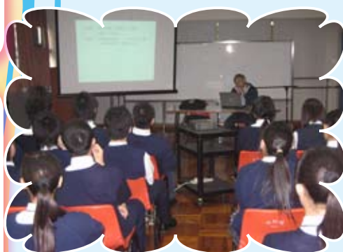
中文科與科學科合辦講座