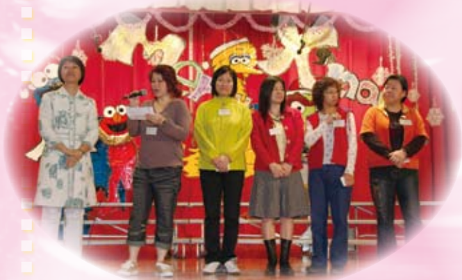
家長教師會主席發言感激老師