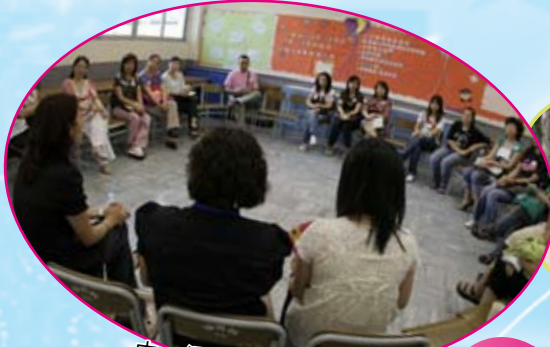
中一級家長座談會