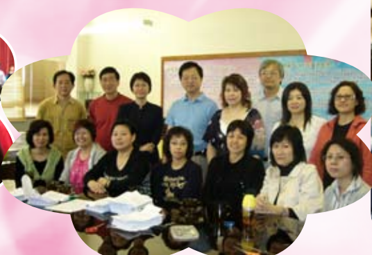
家長教師會與家長校董合照