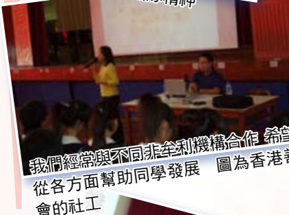
我們經常與不同非牟利機構合作，希望能從各方面幫助同學發展。圖為香港善導會的社工