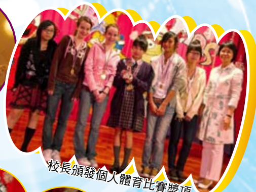
校長頒發個人體育比賽獎項