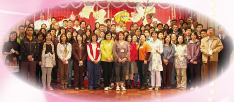
本校教師接受敬師咭