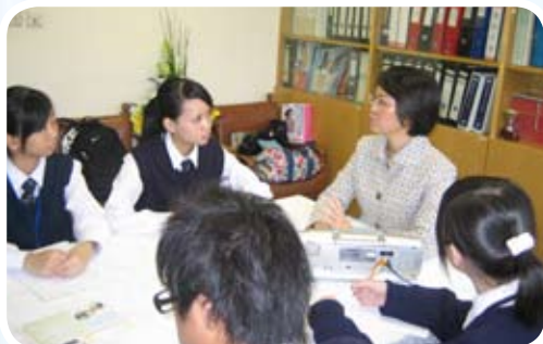
謝校長回答記者發問

相信很多同學都知道，究竟教師和校長，兩者角色有甚麼分別呢？「其實，分別是有的。當老師能夠比較容易接觸學生，從微