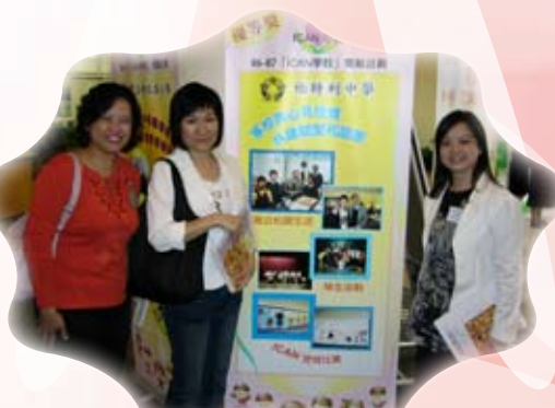
家長也來為我們打氣