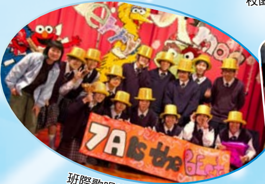
班際歌唱比賽_冠軍