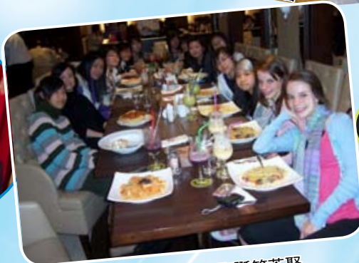
合唱團工作人員_聖誕節茶聚