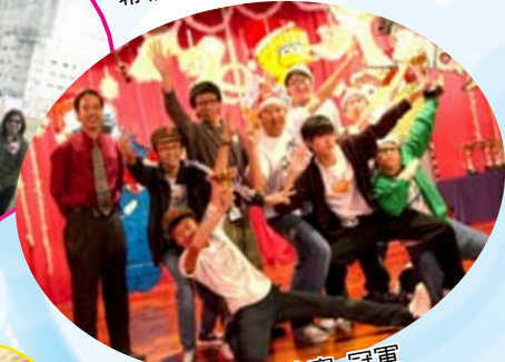
小組歌唱比賽_冠軍