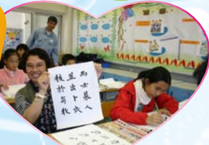
元朗區小學生升中觀校日 本校中文科工作坊