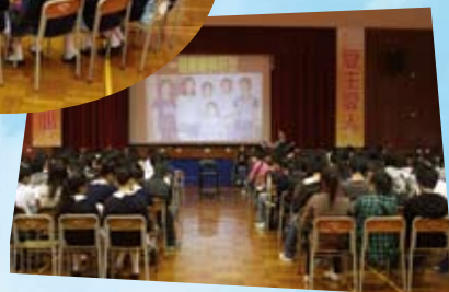
十二月份少福主領嘉賓「回聲谷傷健福音協會」同工分享見證