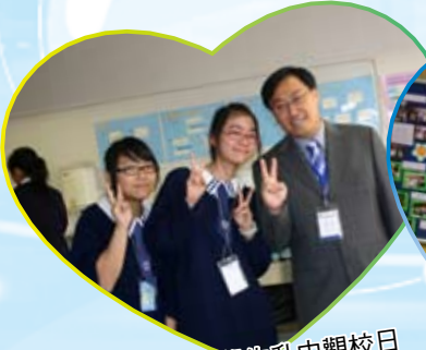
元朗區小學生升中觀校日 本校數學科工作坊