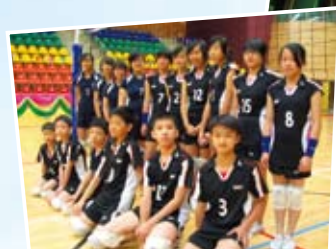
參與假期集訓隊員合照