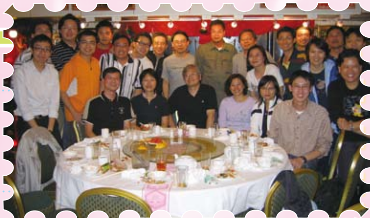
教師發展日後同工晚宴