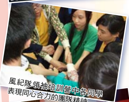
風紀隊領袖培訓營中各同學表現同心合力的團隊精神