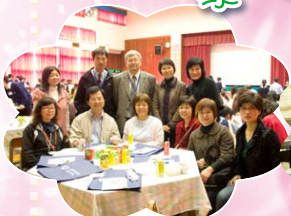
家長校董選舉點票時攝