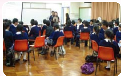
<新紀元國際時裝有限公司>--(K2時裝)人力資源部高級經理及電腦部主管到校為學生舉辦一個「真情對話」工作坊。