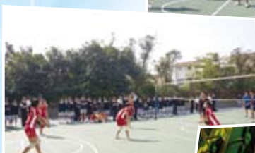
福音排球師生挑戰賽(總決賽)