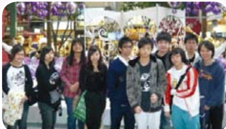
同學參加「明日領袖高峰論壇2007」