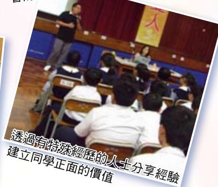
透過有特殊經歷的人士分享經驗，建立同學正面的價值