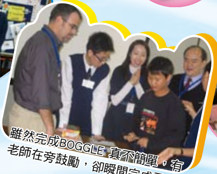
雖然完成BOGGLE真不簡單，有 老師在旁鼓勵，卻瞬間完成了。