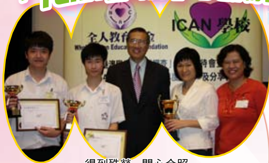
得到殊榮，開心合照

本校自2005-2006參加「ICAN 全人教育」，至今已三年。推行課程的目的是希望「締造開心和諧校園，培育成功進步學生」。經本校師生共同努力下，得到「全人教育基金」的嘉許和表揚，分別於2005-2006獲「ICAN 學校」獎勵計劃中學組銅獎，以及於2006-2007年獲優等獎。此外，我們推薦同學參加「ICAN學生」選舉，經評審團面試後，有兩位同學得到「傑出ICAN學生」的榮譽：