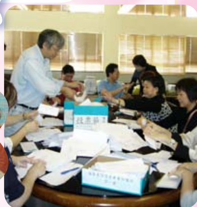
家長教師會十分支持本校各項活動