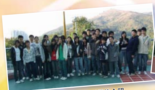
風紀隊精英參加培訓營後合照