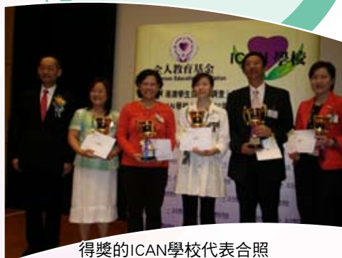
得獎的ICAN學校代表合照

此外，我們有兩位熱心的家長參加「ICAN家長推動大使」，配合學校推動「ICA全人教育」，發揮家長之間互相學習和支持的作用。