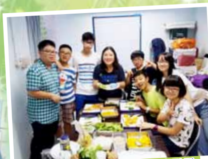
飛鷹成長計畫導師與成員樂也融融