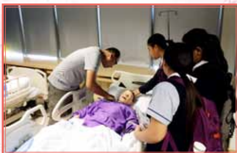
參觀東華學院護士學校實驗室