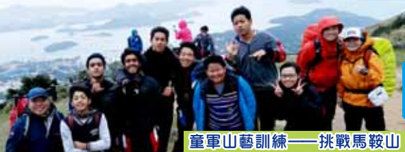
童軍山藝訓練——挑戰馬鞍山

訓導組與輔導組合作，實施關愛共融政策，在開學初期為中一新生舉辦輔導日，關顧新同學，促進他們適應中學陌生的學習環境以及全新的校園文化。