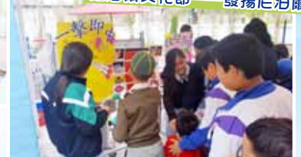
為區內小學設計中文學習活動