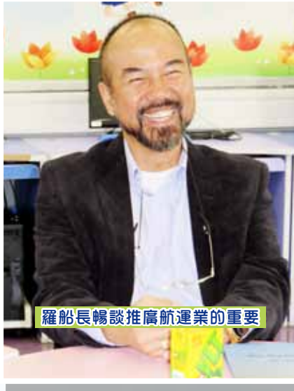
羅船長暢談推廣航運業的重要

的朋友、工會及業界有心人士齊心推廣航運業，實在不遺餘力。他經常為中學生舉辦就業講座；在各大專院校進行推廣，讓更多的年輕人了解航運業的前景；與海事訓練學院合作，舉辦船上知識英語訓練班，為有志從事航運業的學生尋找職位；積極尋求業界支持和政府資助，為接受訓練的海事人員或工程師提供援助。經過長期推廣，學成歸來而從事航運業的人數漸見上升。羅船長專注事業之餘，也熱心公益，令人敬佩。