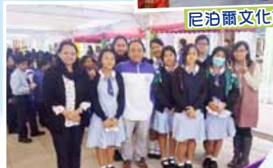
訪問及服務區內小學