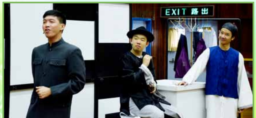
話劇內容貫穿古今