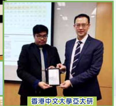
香港中文大學亞太研究所行動研究計畫