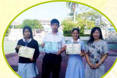
班際壁報設計比賽初中組 季軍 3B 亞軍 3C 冠軍 1B