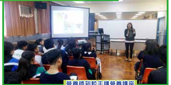
營養師到校主講營養講座

健康校園發展組推行「好人好事 LIKE」活動，對象包括全校師生、教職員及工友，透過讚揚良好行為，建設關愛校園。凡讚賞他人及受到讚賞的同學均可獲飛躍卡乙張，以茲鼓勵。全年共兩期，收集學生、老師記錄的好人好事，每期選出具代表性的好人好事，讓學生投票，獲最高票數的學生頒予「好人好事 LIKE 人氣獎」，以作表揚。