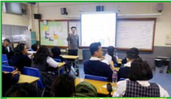
Shine Centre 派員到校進行「時間管理」工作坊

與不同機構合作，舉辦成長課，促進學生的德育發展，包括衛生署「成長新動力」課程及基督教勵行會閃耀坊 (Shine Centre) 成長課。