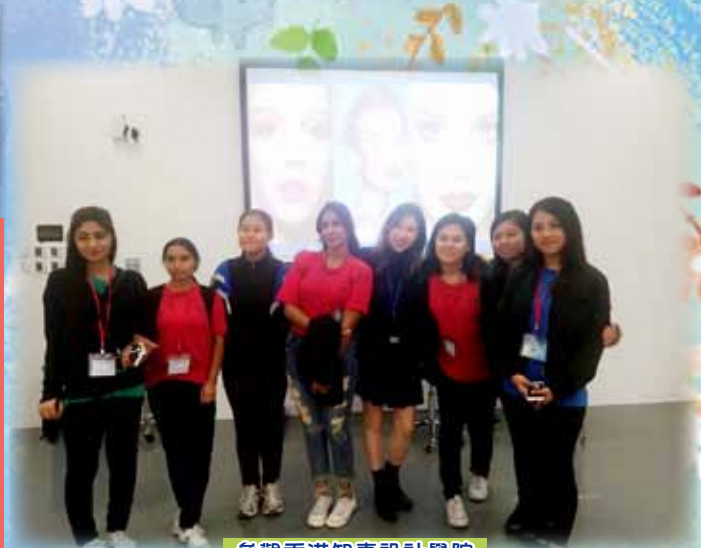
參觀香港知專設計學院

計畫的主要對象是中六級非華語生，為他們舉辦學生培訓課程、職場走訪及工作體驗活動，把他們的生涯志向與職場世界連繫起來。明愛青少年及社區服務註冊社工於9月30日舉行1.5小時的教師培訓工作坊，講題為 Cultural Sensitivity Sharing: Creates Harmonious Campus, Embrace (NCS) Students' Dreams，讓教師掌握生涯規畫的概念。另於家長日為非華語學生家長進行生涯規畫支援及輔導。