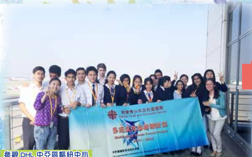
參觀 DHL 中亞區樞紐中心

為了非華語學生、家長及教師更了解生涯規畫，裝備自己，本組與香港明愛青少年及社區服務合辦「為非華語中學生提供與就業相關的經歷計畫」。