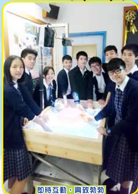
即時互動，興致勃勃