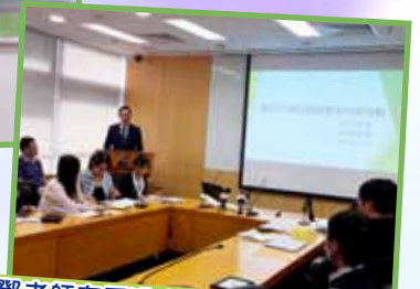
鄧老師在香港中文大學報告及分享