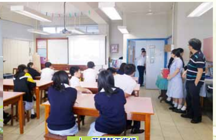
一人一花種植工作坊