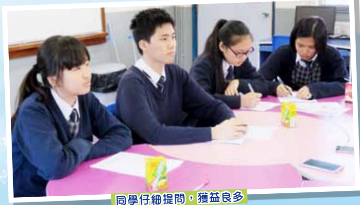
同學仔細提問，獲益良多

羅船長表示全球百分之八十的貨物以船隻運載，雖然飛機亦能運貨，可是成本高昂，貨運量也較船舶遜色，所以現今貨物的運送仍以海運為主。他表示香港航運業前景明朗，就業率仍然是百分百。航海業入行要求相對不高，文憑試 5 科合格或 12 分以上即可。他們會協助畢業同學尋找練習生職位，讓他們上船實習，實習完畢考獲二副牌照後，起薪點有 2 萬元以上，是投身航運業的跳板，將來薪金優厚，前途無可限量。