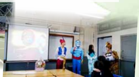
趁墟做老闆——展銷會簡報會比賽預演