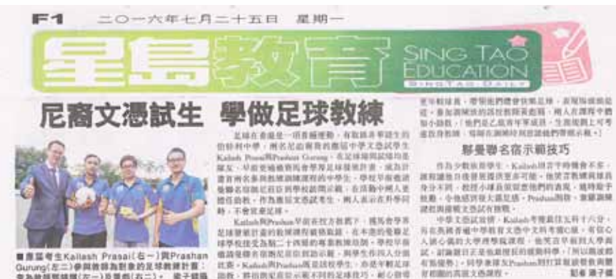
星島日報報道本校活動