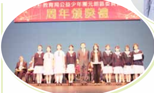
公益少年團傑出團隊獎