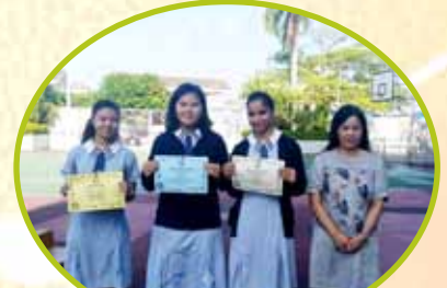
班際壁報設計比賽高中組 季軍 4C 亞軍 6A 冠軍 5A