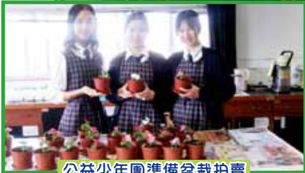
公益少年團準備盆栽拍賣