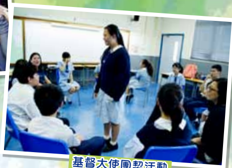
基督大使團契活動