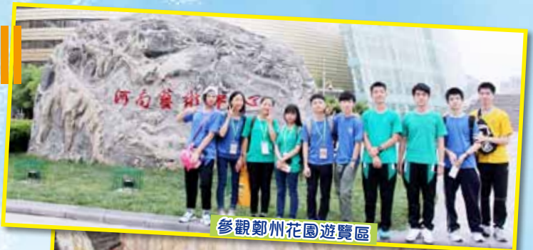
參觀鄭州花園遊覽區

地理科同學於 2016 年 6 月 26 日至 30 日參與教育局「同行萬里」高中學生內地交流計畫之河南省鄭州、洛陽歷史文化與黃河管理之旅。考察活動讓同學作親身的學習體驗，認識河南省的歷史文化及黃河整治情況，加深同學對祖國的認識，開拓視野；也透過觀察、討論和反思，提升同學分析能力。同學完成考察後，為中三級同學作考察報告，分享學習經歷及旅程體驗。