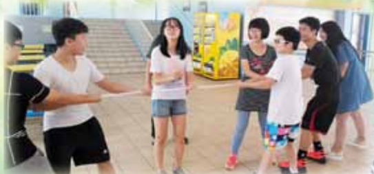
飛鷹成長計畫活動