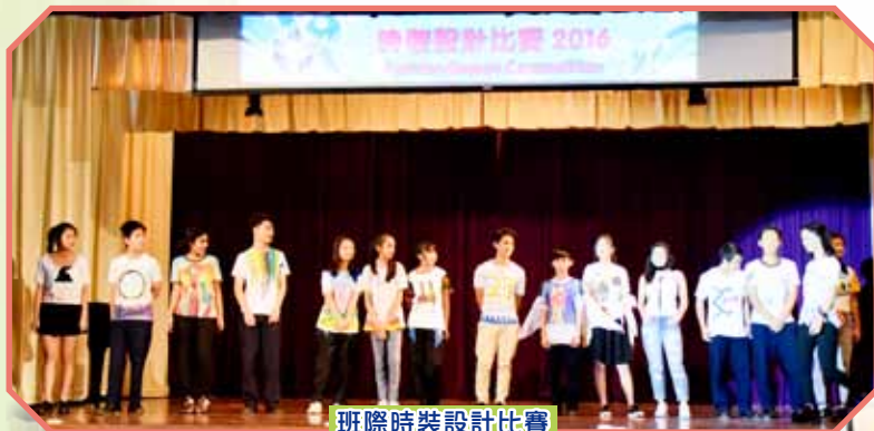
班際時裝設計比賽