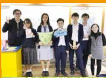
不再孤「讀」朋輩伴讀計畫活動

學習支援方面，舉辦不再孤「讀」朋輩伴讀、中三級「喜閱寫意」計畫、「讀屏軟件」計畫、言語治療服務計畫、校本教育心理學家駐校計畫、個別學習計畫、初中課後功課輔導班；關顧及其他學習經歷方面，舉辦中一級共融價值教育課、關顧面談計畫、「相聚一刻」計畫、午膳聯誼活動、共融週會及「義勇群英」義工服務課程。