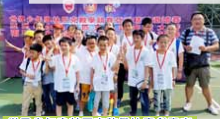
世界少年奧林匹克數學比賽參賽者