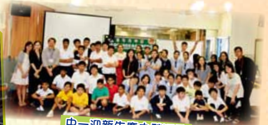
中一迎新慶中秋活動