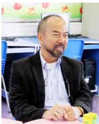
羅船長細說讀書和考牌的經過

羅船長曾經在貨櫃碼頭當副經理，他說：「考獲船長執照，我個人的航海知識水平已和一般經理在同一級別了，但是沒有足夠相關的工作經驗，並不能立刻晉升為經理，尚要從經理以下的級別做起。」為了他的航運事業，他不斷努力進修，充實自己，先後考獲愛爾蘭都柏林大學管理（榮譽）學士學位、英國華瑞漢普敦大學法律（榮譽）學士學位、英國倫敦大學海事法碩士學位，又成為英國航海學會香港分會資深會員及香港海事科技學會會員，可見羅船長為人踏實，勤奮上進。