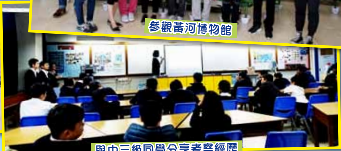
與中三級同學分享考察經歷