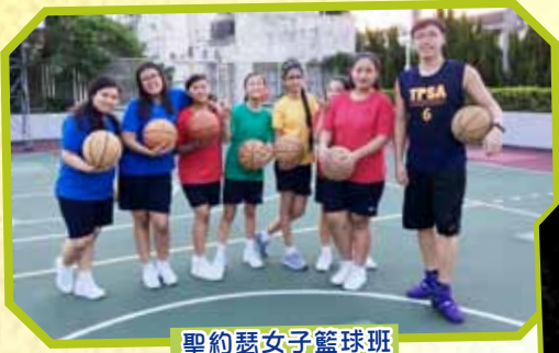
聖約瑟女子籃球班