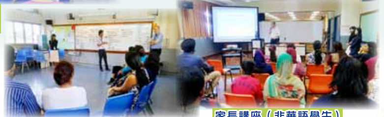
家長講座（非華語學生）