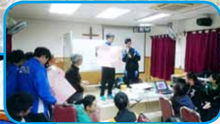
聯校領袖訓練營活動