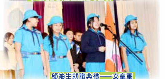
領袖生就職典禮——女童軍