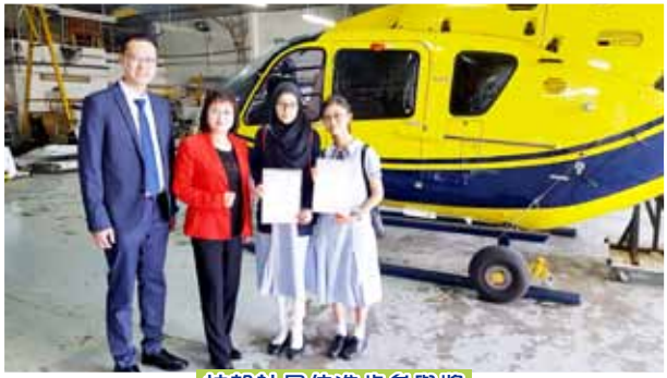
扶輪社最佳進步參與獎