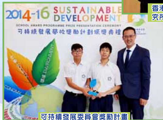
可持續發展委員會獎勵計畫