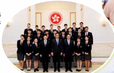
少年警訊獲邀參觀禮賓府