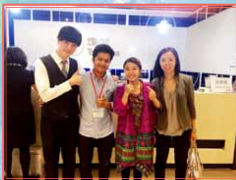
工作影子計畫學員活動