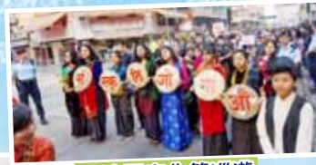
尼泊爾文化節巡遊