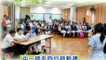
中一師友同行啟動禮