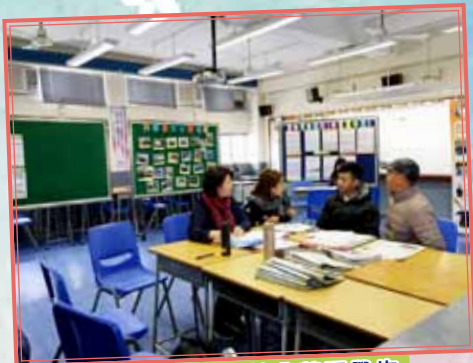
註冊社工為本校非華語學生及家長提供生涯規畫支援