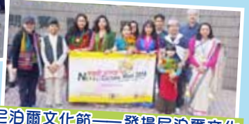
尼泊爾文化節——發揚尼泊爾文化