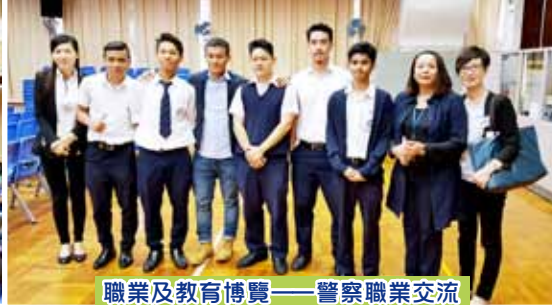
職業及教育博覽——警察職業交流