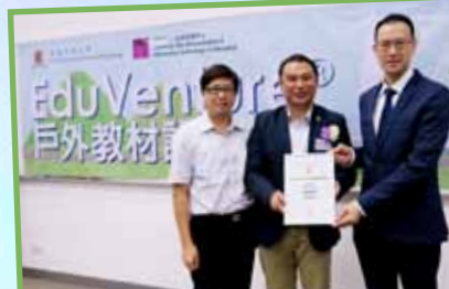
中文大學戶外教材設計比賽優異獎