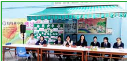
公益少年團舉辦慈善花卉拍賣