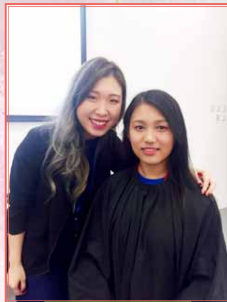
工作影子計畫——形象設計