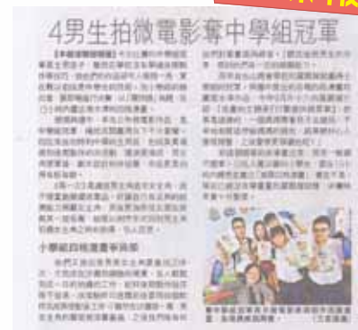
成報報道本校少年警訊獲獎