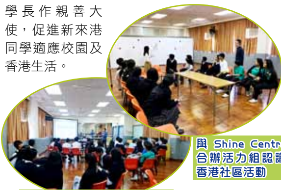
與 Shine Centre 合辦活力組認識 香港社區活動

活力組為新來港學童提供適切的支援，包括學習及生活適應，因此舉辦有關的學術課程，以提升新來港學童的學習能力及學業水平，也舉辦多元化的學習經歷活動，讓同學有更多機會認識香港社區，提升自信心。本年度推行多個項目，學習支援方面，舉辦中文繁體字及粵音訓練課程、英文增潤課程及課後功課輔導班；關顧及其他學習經歷方面，包括「朋輩關顧計畫」暨〈家·港·情〉活動計畫（校本課程），讓高年級的學長作親善大使，促進新來港同學適應校園及香港生活。