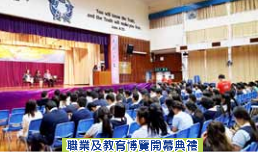
職業及教育博覽開幕典禮