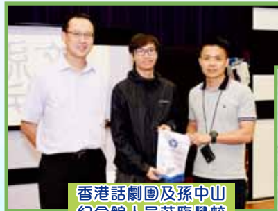
香港話劇團及孫中山紀念館人員蒞臨學校