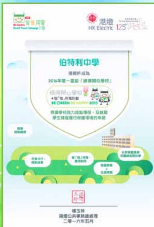
榮獲香港電燈公司綠得開心學校獎