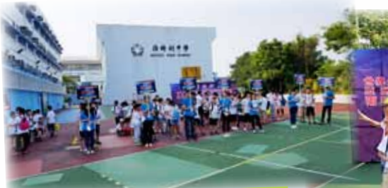
世界少年奧林匹克數學比賽