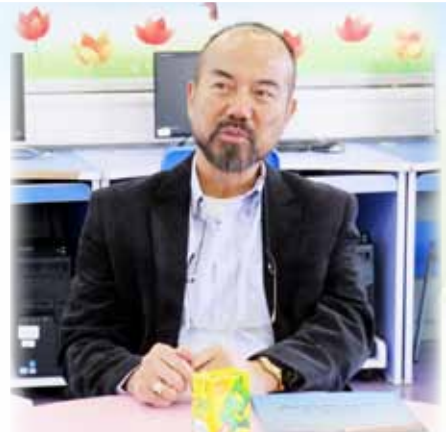
羅船長分享中三發憤讀書的往事

最初他望文生義，以為「海洋科學」是研究海洋生物，將來可以到海洋公園工作，後來他上學時才知道「海洋科學」原來是與航運業相關的學科。雖然如此，他對航海逐漸產生濃厚的興趣。在修讀文憑的首兩年，他在理工學院學習專業知識，之後他到船上當甲板練習生，實習兩年，並在香港海事處考試，取得遠洋二副牌畢業。在船上工作1年後，他更遠赴澳洲在職帶薪進修1年，攻讀船長牌，踏上康莊大道。