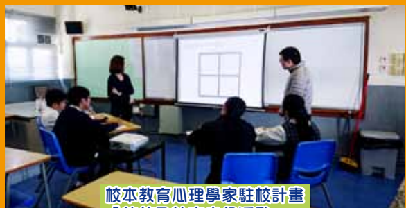
校本教育心理學家駐校計畫 「情緒及社交小組活動」

活力組為新來港學童提供適切的支援，包括學習及生活適應，因此舉辦有關的學術課程，以提升新來港學童的學習能力及學業水平，也舉辦多元化的學習經歷活動，讓同學有更多機會認識香港社區，提升自信心。本年度推行多個項目，學習支援方面，舉辦中文繁體字及粵音訓練課程、英文增潤課程及課後功課輔導班；關顧及其他學習經歷方面，包括「朋輩關顧計畫」暨〈家·港·情〉活動計畫（校本課程），讓高年級的學長作親善大使，促進新來港同學適應校園及香港生活。