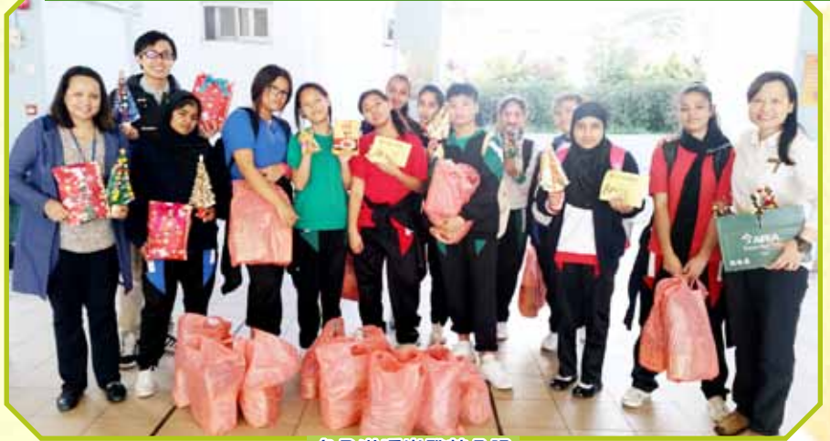
冬日送暖出發前合照

輔導組相信每位同學都是獨特而唯一的，因此致力推動學生全人發展，發掘學生各種潛能，培育學生多元智能。輔導組透過不同活動，如班際壁報設計比賽、每月點歌加油站、女子排球訓練、女子籃球訓練、義工服務、講座、課外活動、訓練營等，培養學生溝通能力、解難能力和團隊精神等，提高學生自信心，建立積極的人生觀。