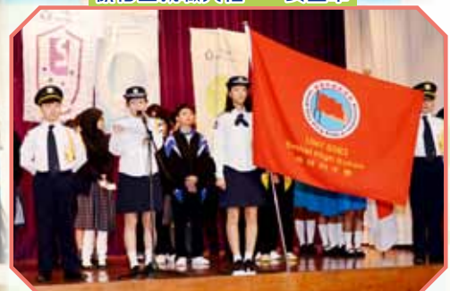
領袖生就職典禮——升旗隊