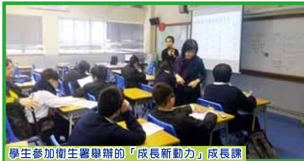
學生參加衛生署舉辦的「成長新動力」成長課