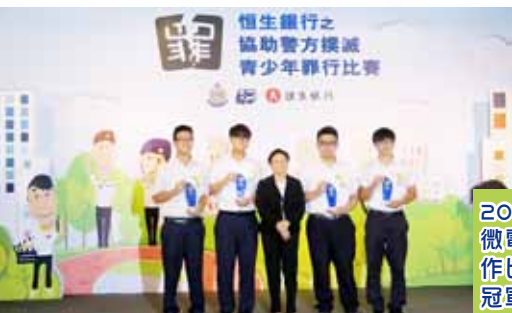
2016 中學組微電影劇本創作比賽全港總冠軍