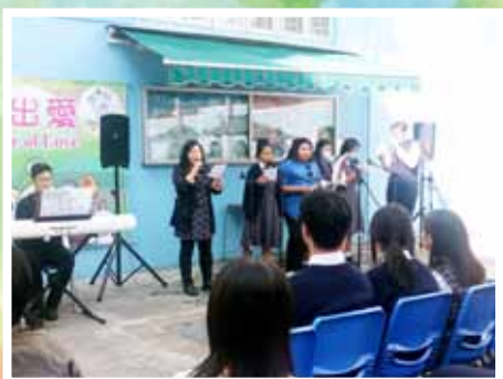
福音大巡遊後一起唱福音週主題曲