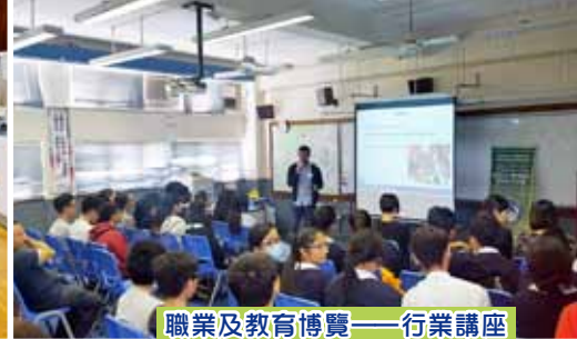
職業及教育博覽——行業講座