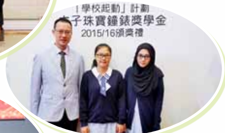
太子珠寶鐘錶獎學金